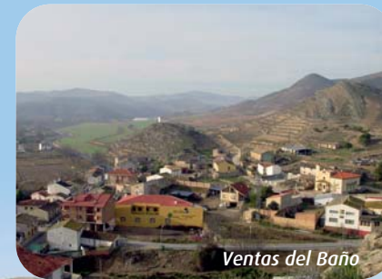
Ventas del Baño

especial en su transcurrir por este barrio, y le da una belleza natural que podrá disfrutar paseando por el Paseo La Rate, que une Las Ventas con el Polígono del mismo nombre, durante el soleado trayecto entre nogales, moreras, castaños y acacias variadas, podrá disfrutar de la unión entre los dos ríos, que dan nombre a nuestra comarca, y han sido declarados por la UNESCO como reserva de la biosfera el 9 de julio de 2.003 .