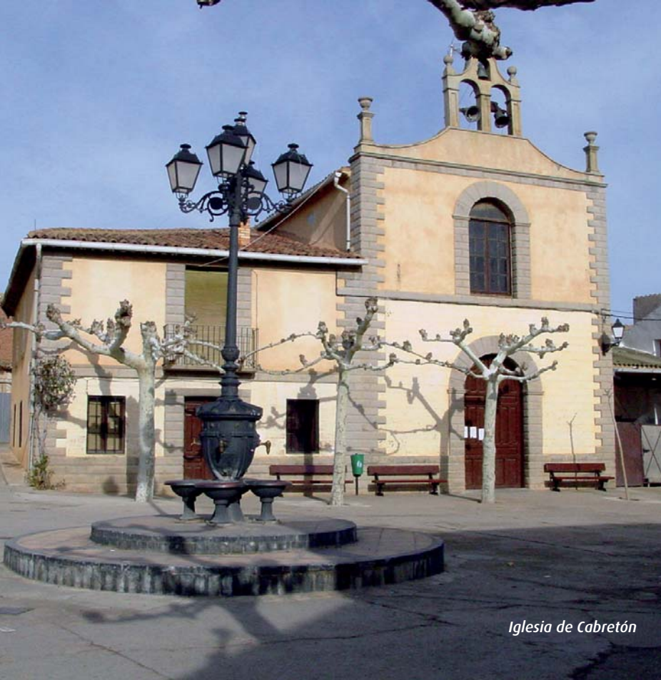
Iglesia de Cabretón